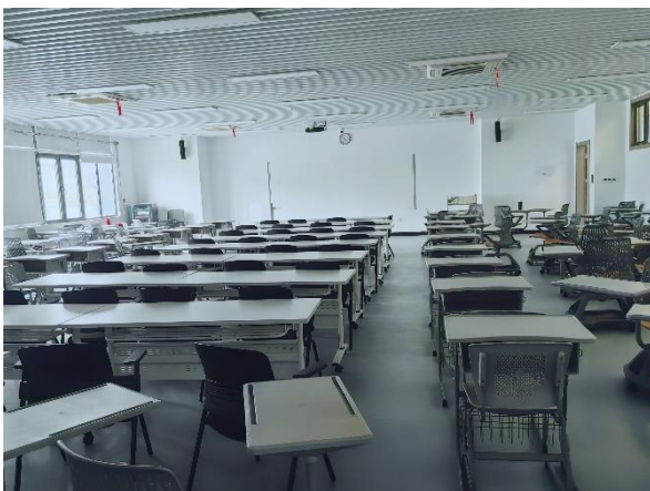
Moderner Klassenraum für 50 Schüler*innen