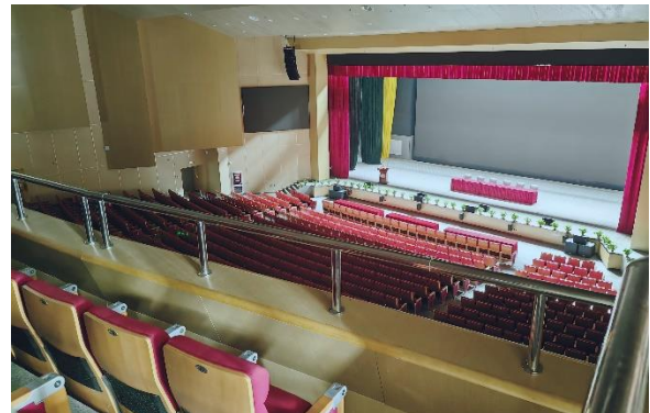
Die imposante Schulaula