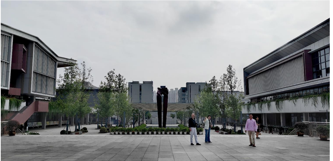
Campus der Partnerschule in Nanjing